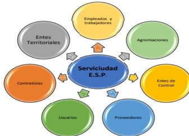
IMAGEN Nª1. PARTES INTERESADAS